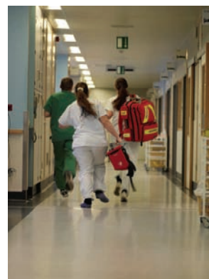
Travail en équipe