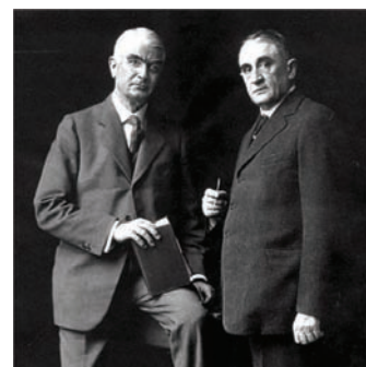
No one is big enough to be independent of the others (William Mayo, 1889)

pour nous-mêmes lorsqu'une maladie ou un accident les contraint, ou nous amène, à séjourner dans un hôpital.