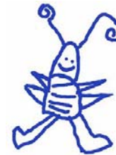
Table ronde – Rondvraag

Conventie van het Interuniversitair ReferentieCentrum In het kader van Cerebral palsy ULB - VUB - Ulg