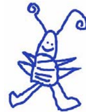
Table ronde – Rondvraag

Conventie van het Interuniversitair ReferentieCentrum In het kader van Cerebral palsy ULB - VUB - Ulg